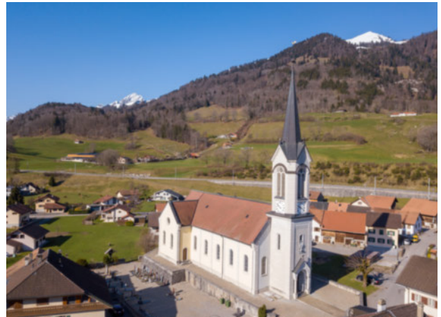
Eglise Notre-Dame, Albeuve

En 2002, les quatre communes, Albeuve, Lessoc, Montbovon et Neirivue, se réunissent pour ne former qu'une seule grande commune, Haut-Intyamon. Situé à 15 minutes de Bulle et de Château-d'Oex, le village d'Albeuve compte 1600 habitants. L'émotion des lieux vous ravira par sa nature préservée et son patrimoine culturel.