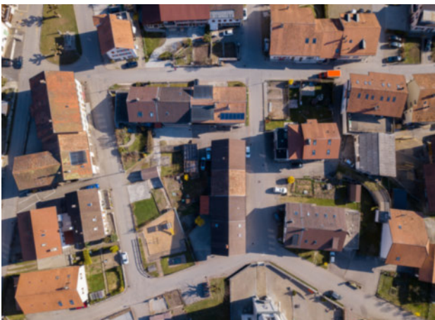
Rue de l'Eglise, Albeuve

Construite en 1877 et rénovée en 2019, cette demeure séduira les amoureux de paysages bucoliques, à la recherche de grands espaces et de sérénité.